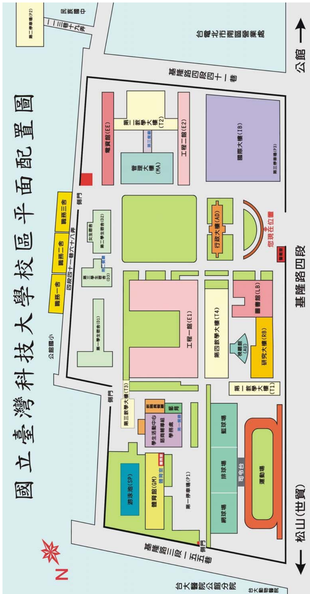
附表(三) 立台灣科技大學地理位置圖